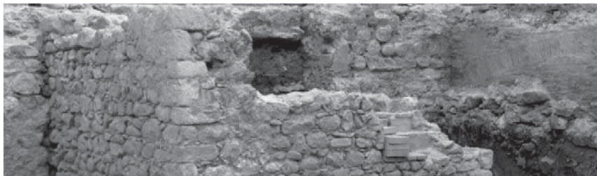
Torre de la muralla. 2005

L'origen urbanístic de la ciutat actual de Granollers és el resultat del creixement de la ciutat medieval, fortament condicionat per l'evolució del seu mercat. Tot i que moltes vegades passen desapercebuts alguns espais i construccions medievals, en el que s'anomena centre històric encara se'n poden observar un bon nombre d'exemples i testimonis. La visita que proposem permetrà reconèixer-los, alhora que aprendrem el seu interès testimonial i patrimonial, tot fomentat els valors de respecte i conservació vers el patrimoni comú.