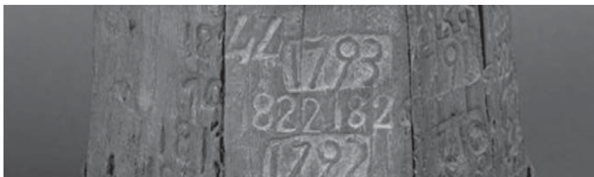
Mesura de Gra MDG-1015

Ciències Socials: Història, Patrimoni Matemàtiques