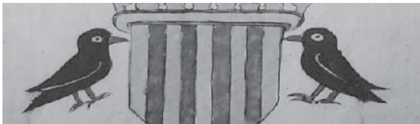
Libre de Clavaria. S.XVI AMGr

El Centre d'interpretació històrica de L'Adoberia planteja un recorregut per la història de la ciutat de Granollers, la seva formació, creixement i modernització, des dels seus orígens en època alt medieval fins al segle XIX. El Govern de la ciutat és una activitat pensada per conèixer com elegien els càrrecs municipals, quins eren o quins serveis oferia als ciutadans, temes que esdevenen un recurs complementari per a un treball comparatiu amb l'organització política i administrativa de la ciutat actual.