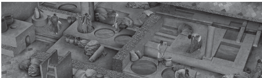
Dibuix hipotètic de l'adoberia d'en Ginebreda (detall) Autor: Guillem Hernández Pongiluppi

Ciències Socials: Història, Patrimoni Matemàtiques