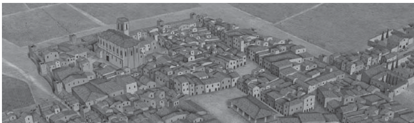
Granollers s.XVI Dibuix de Guillem Hernández Pongiluppi

L'activitat Viure a la ciutat medieval està pensada per introduir els alumnes a alguns dels conceptes bàsics de la història local medieval: Com era la ciutat de Granollers en aquesta època? Quins eren els edificis més importants? Com i qui vivia a la ciutat? Com s'organitzava el govern local? Són temes que esdevenen un recurs per a un treball comparatiu amb el coneixement de la ciutat actual.